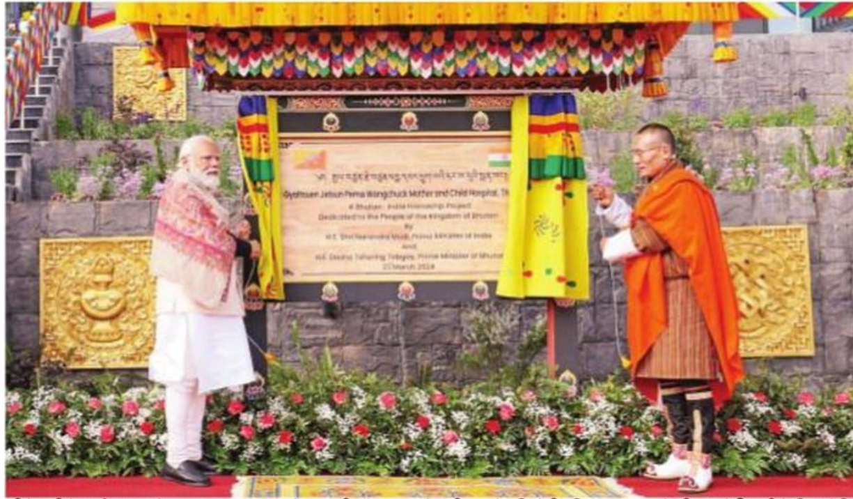
திம்புவில் நவீன மருத்துவமனையை கூட்டாக திறந்து வைத்த பிரதமர் நரேந்திர மோடி, பூடான் பிரதமர் ஷெரிங் டோப்கே.

ரு.22 கோடியில் கட்டப்பட்ட முதல் மருத்துவமனை கடந்த 2019-இல் செயல்பாட்டுக்கு வந்தன.