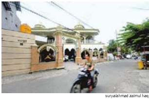
Masjid Al Ibrahim Nuansa religi masih terasa ketika masuk wilayah Kelurahan Gebang Putih, salah satunya adalah Masjid Al Ibrahim yang berada di tengah keramaian Jalan Raya Gebang Putih. ■ iit