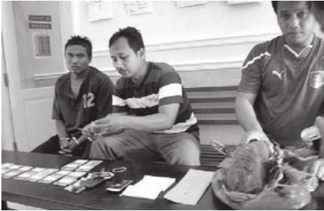
GELAR PERKARA - Polisi menunjukkan sejumlah barang bukti milik korban dalam gelar perkara, Minggu (3/4). Tersangka (kiri) juga dihadirkan.

Korban tak menaruh curiga dan mengikuti saja kemauan tersangka yang membombongkannya menuju rumah petani penju-