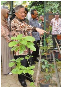
BERI DORONGAN - Kepala Dindik Jatim, Harun, berkunjung ke SMA Semen Gresik memberikan dorongan dan dukungan sekolah berwawasan lingkungan, Sabtu (2/4).

Orang nomor satu di Dindik Jatim ini rela blusukan ke daerah