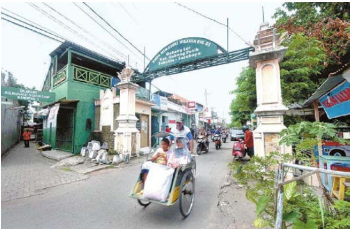
PINTU GERBANG - Tugu kembar menjadi pertanda memasuki kawasan Kampung Gebang, Surabaya.

Menurutnya, sawah dan tegalan milik warga asli Gebang ini sudah laku, sebagian dari mereka membangun tempat kos dan tempat usaha, sebagian lagi memang dijual kepada pengembang. Tak heran bila sekarang ini kawasan Kampung Gebang sangat padat dan ramai oleh kos-kosan. Seiring dengan keberadaan kos-kosan yang hampir mayoritas dihuni mahasiswa ITS ini, warga setempat menyambutnya dengan membuka warung