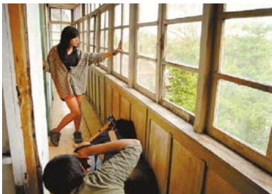
BANGUNAN TUA - Seorang model berpose di depan sejumlah fotografer di salah satu ruang Wisma Tumapel dalam suatu sesi pemotretan di Jl Tumapel Klojen Kota Malang, Minggu (3/4). Kegiatan ini merupakan salah satu variasi sesi pemotretan model berlatar belakang bangunan tua.