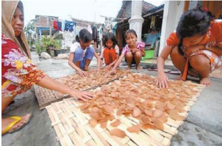
KERUPUK - Warga mengeringkan irisan kerupuk yang menjadi industri rumahan warga di Kampung Gebang.

Dulu, saat melintas di Jembatan Asempayung setiap pengendara sepeda wajib turun dan menuntun sepeda yang dikendarainya. Jika tidak pengendara sepeda itu akan celaka dan masuk kedalam sungai yang berada di pinggir jembatan. "Benar atau tidak ceritanya memang seperti itu," paparnya. ■ iit