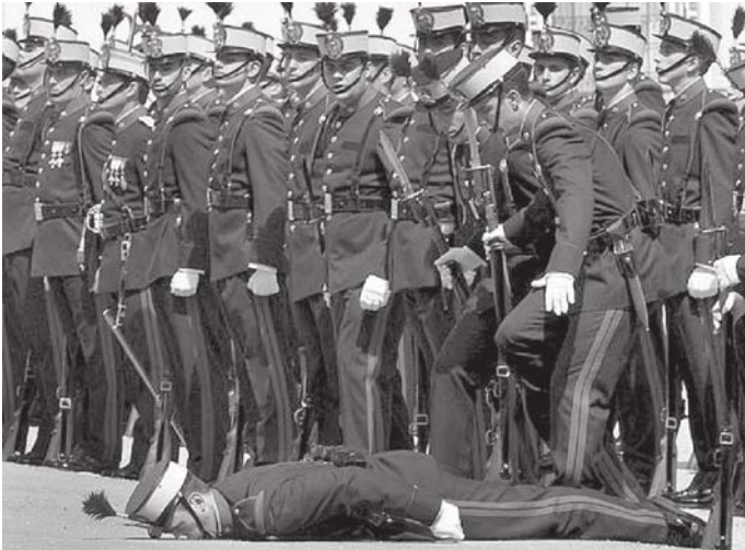
PASUKAN PINGSAN - Anggota Pasukan Pengawal Spanyol roboh pingsan saat mereka menyambut kunjungan kenegaraan Pangeran Inggris Charles dan Putri Camilla di pinggiran Kota Madrid, Kamis (31/3).