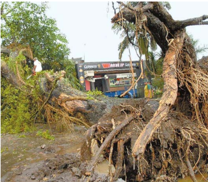
TUMBANG - Sebuah pohon trembesi raksasa berusia satu abad tumbang menimpa Waroeng Jip di Jl Ki Ageng Gribig, Kecamatan Kedungkandang Kota Malang, Minggu (3/4).