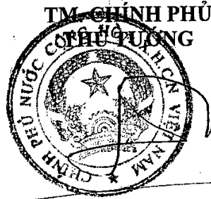
Nguyễn Tấn Dũng